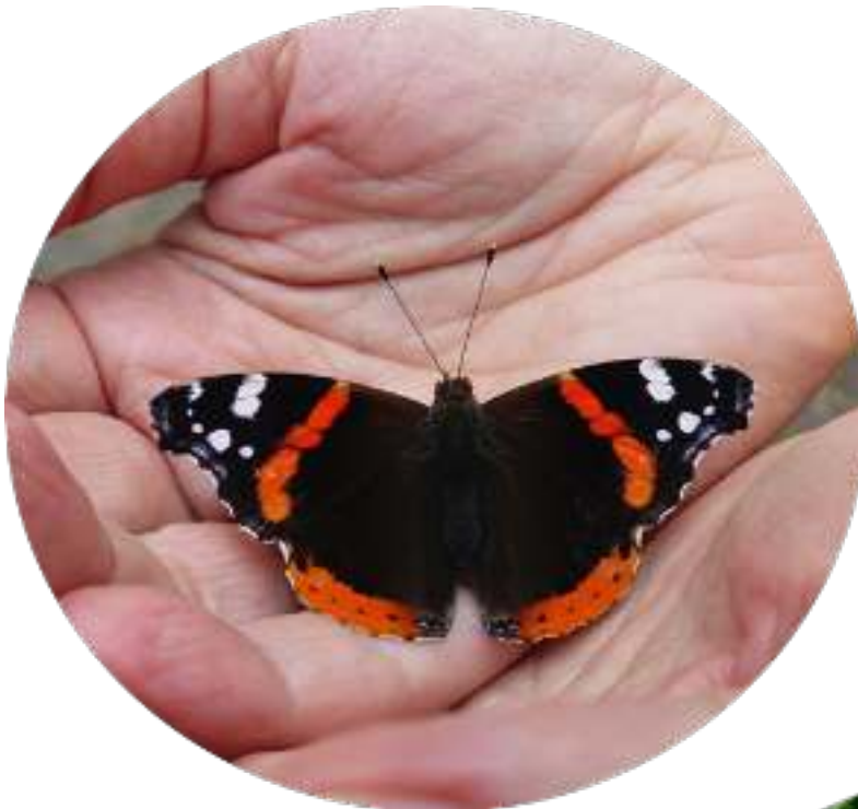
twee foto's van een paar jaar geleden

Bij de Aldi was het bedrag € 32,64!! (32 en 32 \times 2! ) en de week daarvoor € 32,32!! Mijn moeder is bij ons, daar hoeven we niet meer aan te twifelen, willen we ook niet, maar ja de twijfel is er soms ook, maar die komt wel steeds meer in de schaduw.