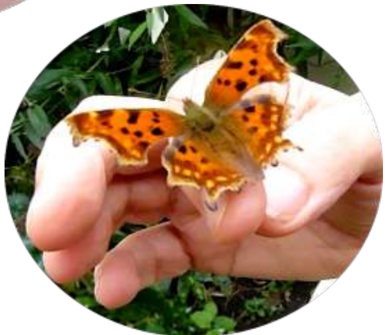
de gehakkelde aurelia op mijn hand