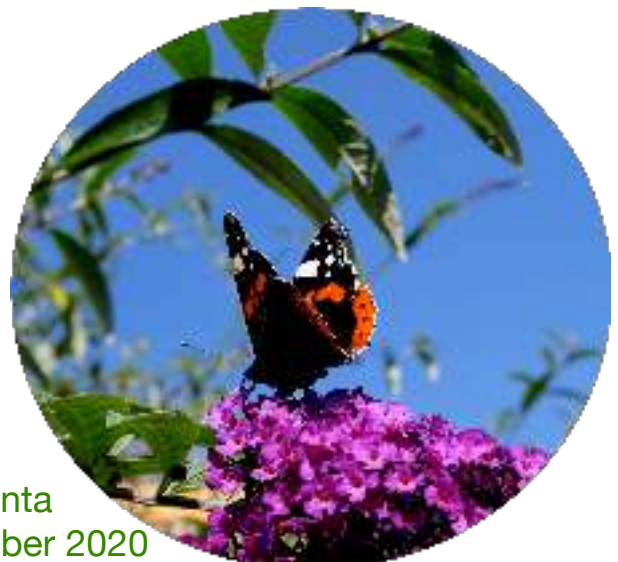
atalanta 19 september 2020