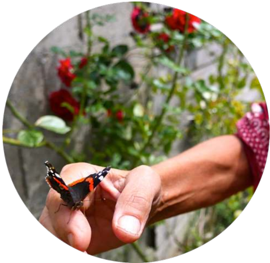
de atalanta op mijn hand