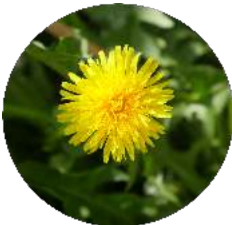
paardebloem 17 april 2020