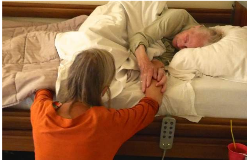
9 augustus 2018 blij en tevreden