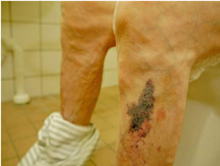
30 mei 2018 grote blauwe plek door de rolstoel of tillift