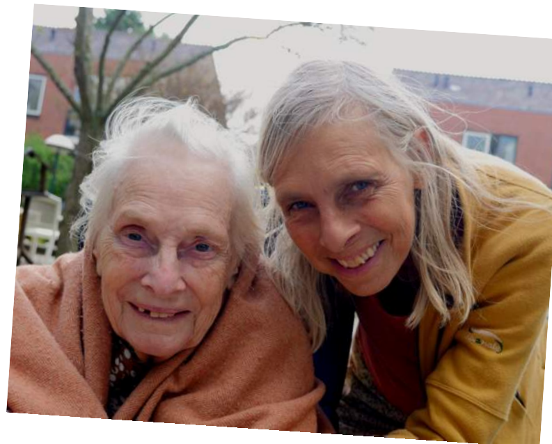
22 september 2018 Een aangijpende foto van mijn moeder. Zo treffen (troffen) wij mijn moeder (vaker) aan als we haar ophalen in de huiskamer en meenemen naar haar kamer en vervolgens uit de rolstoel in haar eigen stoel zetten, waardoor ze bijna meteen een ander mens wordt.